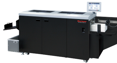
シートカット & クリーサー SMSL-100